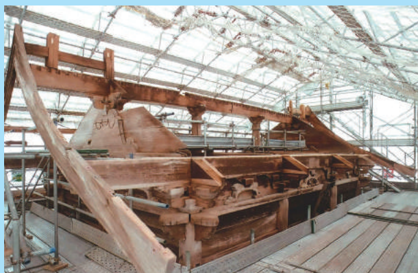
化粧垂木解体後西妻