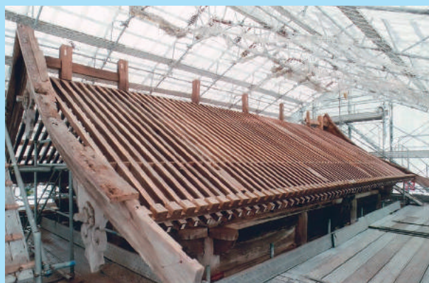
軒廻り解体中西妻