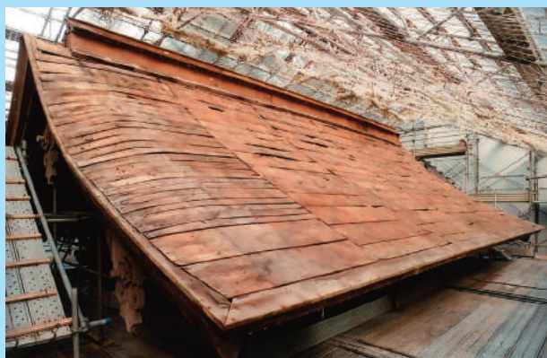
屋根銅板葺解体西妻